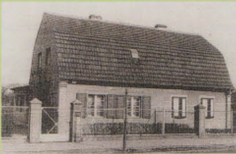
Eines der ersten Häuser im Siedlerweg