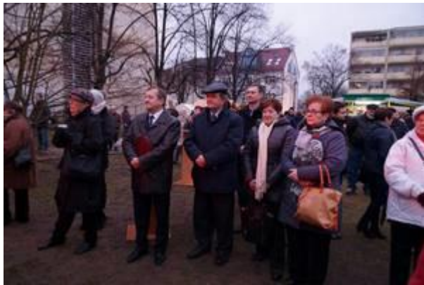
Die Delegation beim Lichterfest