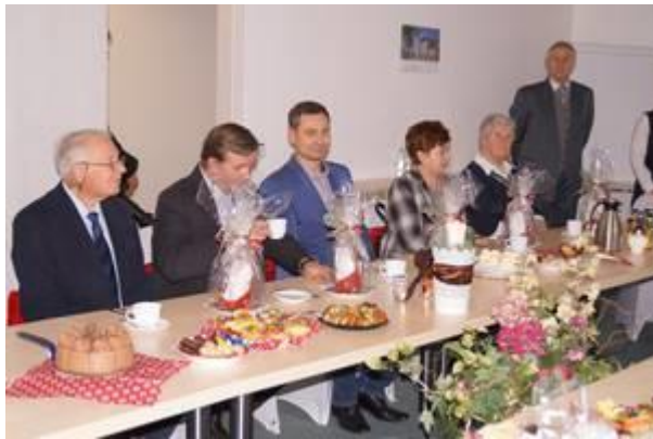
Delegationsmitglieder und Gastgeber