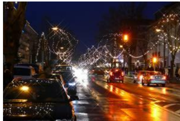
Das Licht ist eingeschaltet...