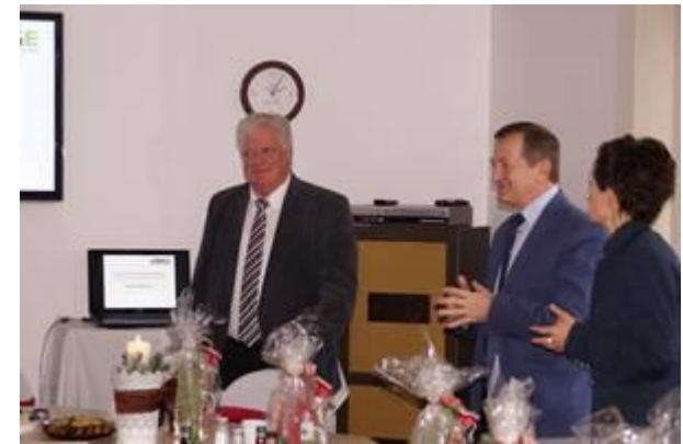
Bürgermeister Jochen Kirsch begrüßt offiziell die Delegation aus Goluchow