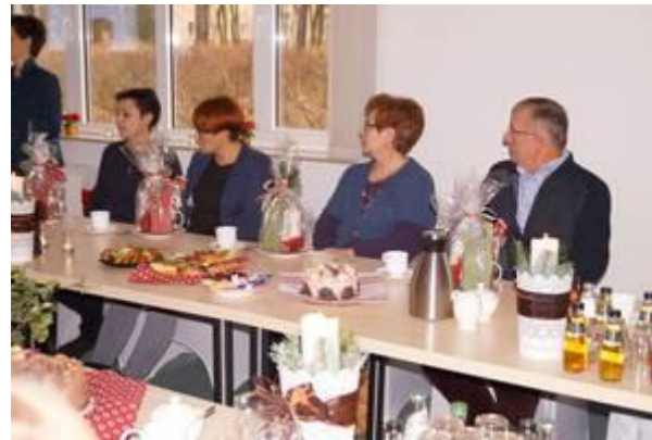
Delegationsmitglieder und Gastgeber