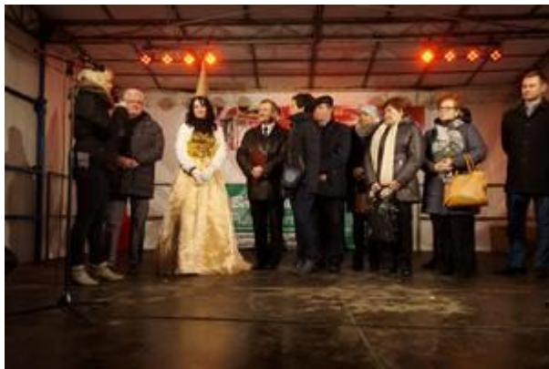
Frau Richter dankt allen Sponsoren und Helfern