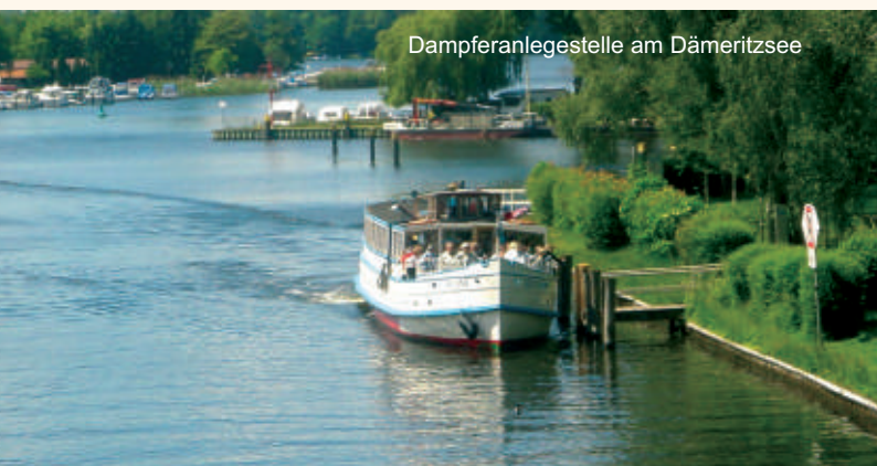
Dampferanlegestelle am Dämeritzsee

Treptow über die Spree nach Köpenick und weiter über den großen Müggelsee die Müggelspree entlang zum Dämeritzsee nach ERKNER. Von hier weiter über das Flakenfließ zum Flakensee und über die Löcknitz zum Werlsee, Peetzsee und Möllensee.