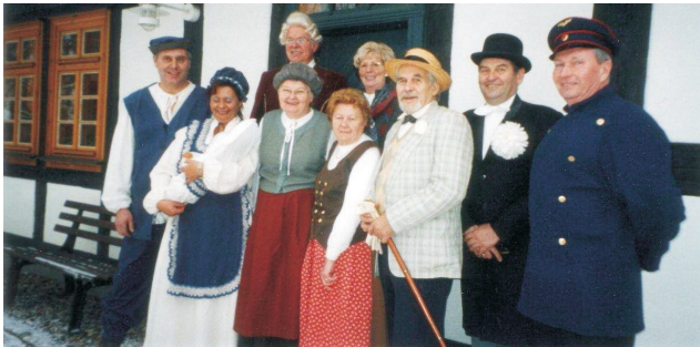
historische Figuren aus Erkner